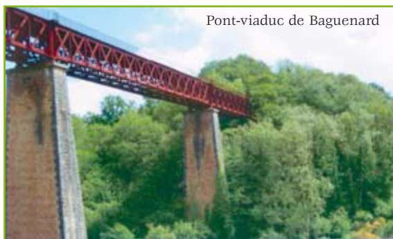
Pont-viaduc de Bagnenard